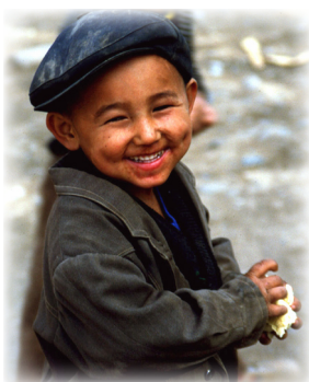
Un chico uighur

En el verano de 2009, se llevó a cabo la violencia étnica más mortífera en China por décadas, debido a una huelga. Oficiales chinos afirman que Rebiya Kadeer, una exitosa mujer uighur y antigua prisionera política, tuvo la culpa de esta violencia. Esta región del noroeste de China, ha sido el hogar tradicional de los uighurs, un pueblo de habla turca, pero China, cada vez ha reubicado a los chinos hans dentro de la zona, ¡porque la población han creció de un 6% en 1949 al 40% en 2000! Y continúa aumentando. Los uighurs sienten que a los chinos hans les han dado preferencias de oportunidades en cuanto a empleos. Ellos hacen mención de la eliminación del idioma uighur para la instrucción en sus escuelas. Los uighurs afirman que el gobierno chino infringe las prácticas musulmanas de ellos durante el mes de Ramadán, insistiendo en que los trabajadores de las fábricas coman. Los pasaportes y visados de salidas para la peregrinación a la Meca se han restringido.