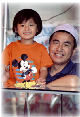
Un padre hui y su hija

Ore que la prioridad de las misiones transculturales en nuestras iglesias, resulte en un gran conocimiento del bien que tenemos en Cristo.