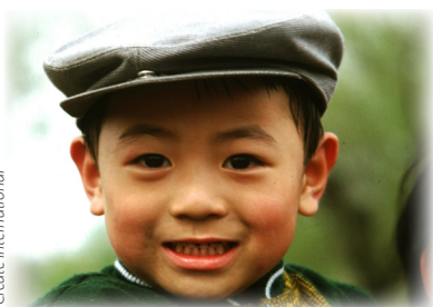
Un chico zhuang

“¡Me gustaría que pudieran ver sus caras!” reporta un obrero de Create International en su carta de oración de diciembre de 2009.